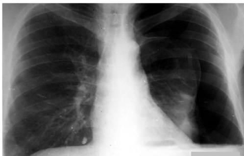
Обзорная рентгенограмма грудной клетки, прямая проекция.

В анализах крови: гемоглобин – 125 г/л, эритроциты – 3,6 \cdot 10^{12} , гематокрит – 35%.